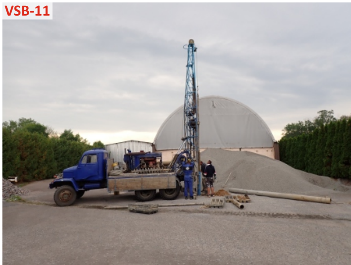
VS-B-11 - hloubení vrtu - pohled severoseverovýchodu