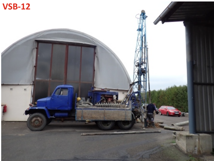
VS-B-12 - hloubení vrtu - pohled jihojihozápadu